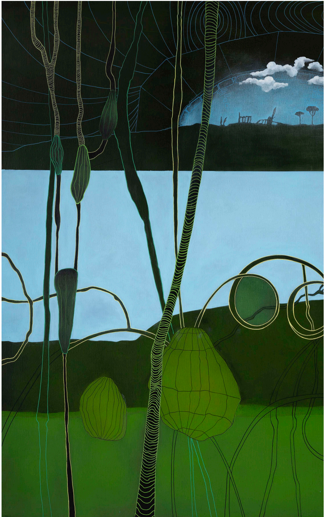
"Som gror" 160 x 200 cm. Akryl, olje og tusj på lerret. 2022 - 2024