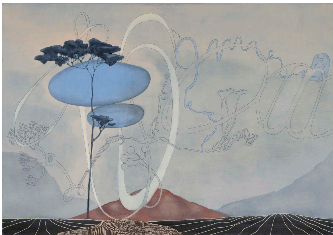
"Fabel" 70 x 100 cm. Akryl, olje og tusj på lerret. 2023 - 2024