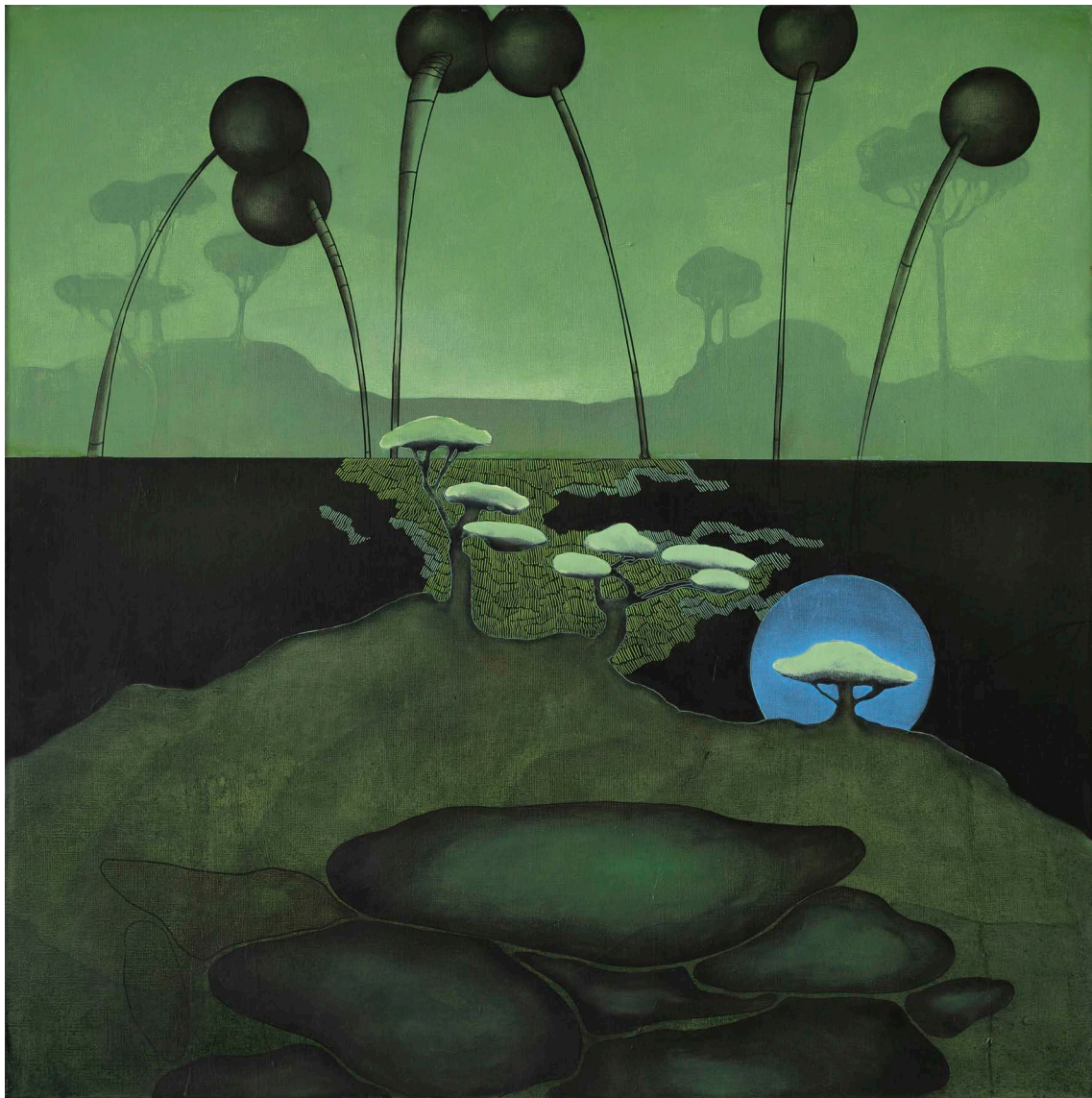
"Etterlandskap II" 100 x 100 cm. Akryl, olje og tusj på lerret. 2023 - 2024