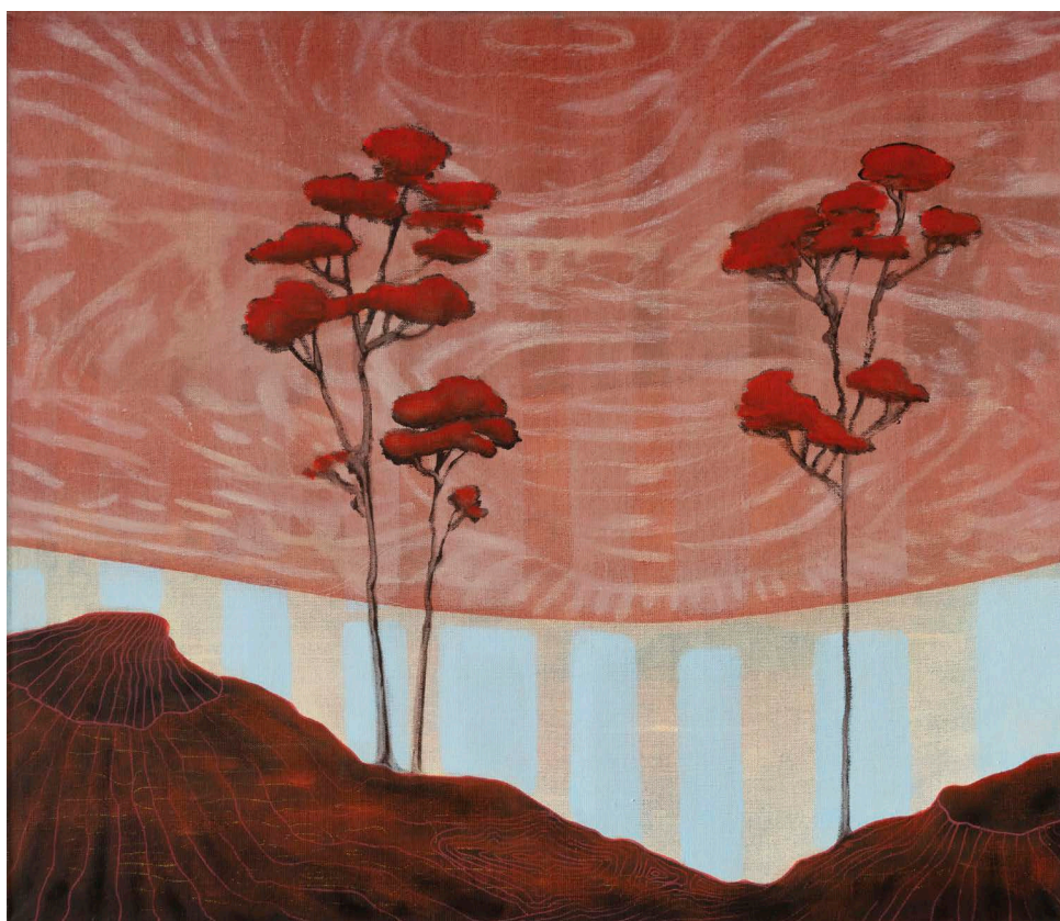
"Morgen" 60 x 70 cm. Akryl, olje og tusj på lerret. 2024