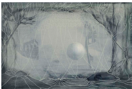
“Scene” 20 x 30 cm. Akryl, olje og tusj på lerret. 2024

“Det underlege som gror der det å sjå, men ikkje forstå, møter det å forstå, men ikkje sjå.”