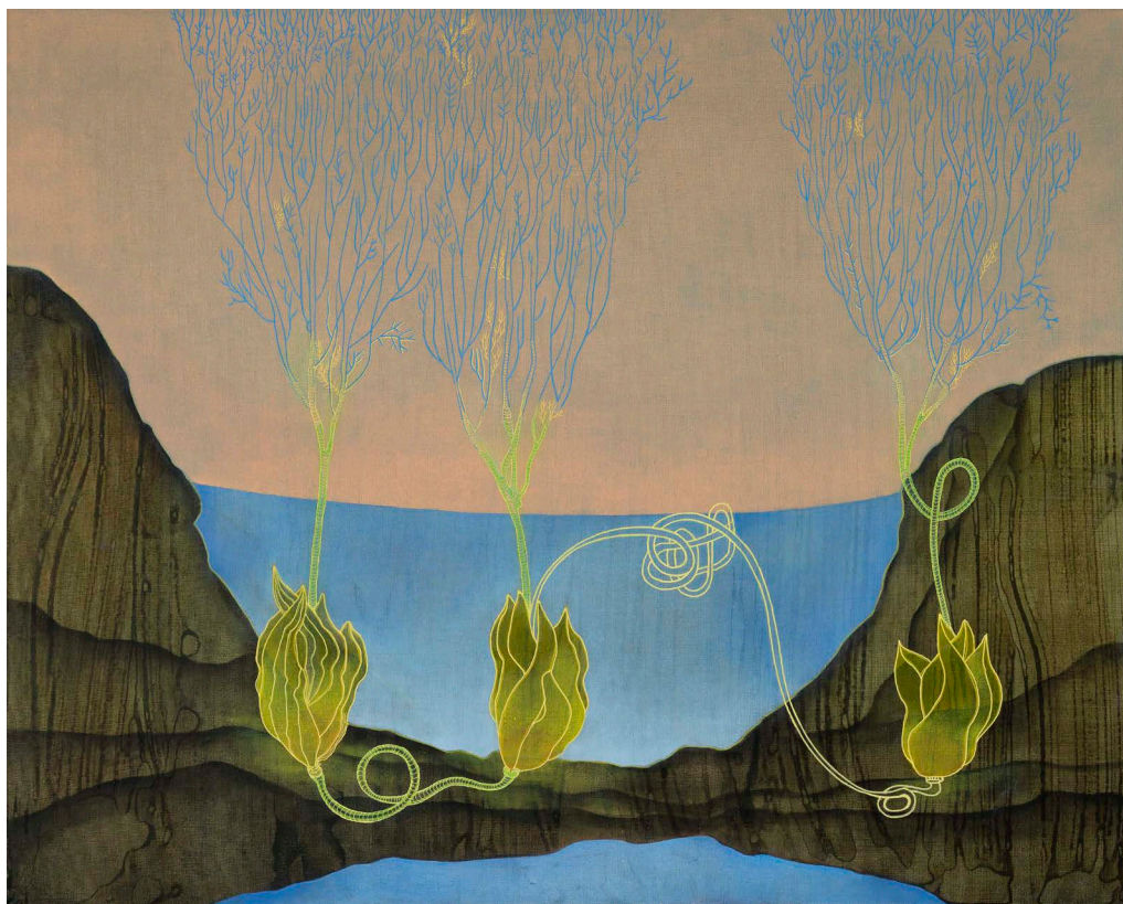
“Havlandskap” 80 x 100 cm. Akryl, olje og tusj på lerret. 2024